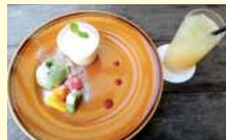
大池遊園でティータイム。