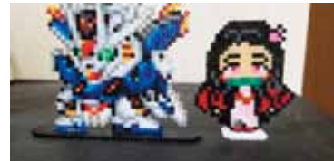
アイロンビーズ作成は人気です。