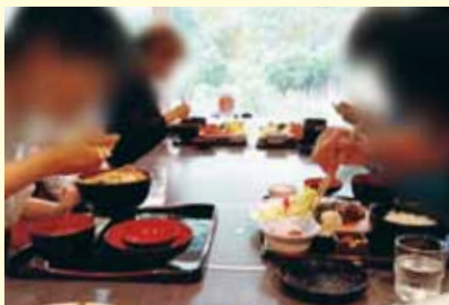
かじか荘での外食。美味しかったよ。