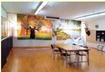
帰りに紀美野自然体験館にも寄ってきました。3Dで恐竜を作成していました。