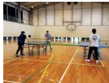
身体も動かさないと。